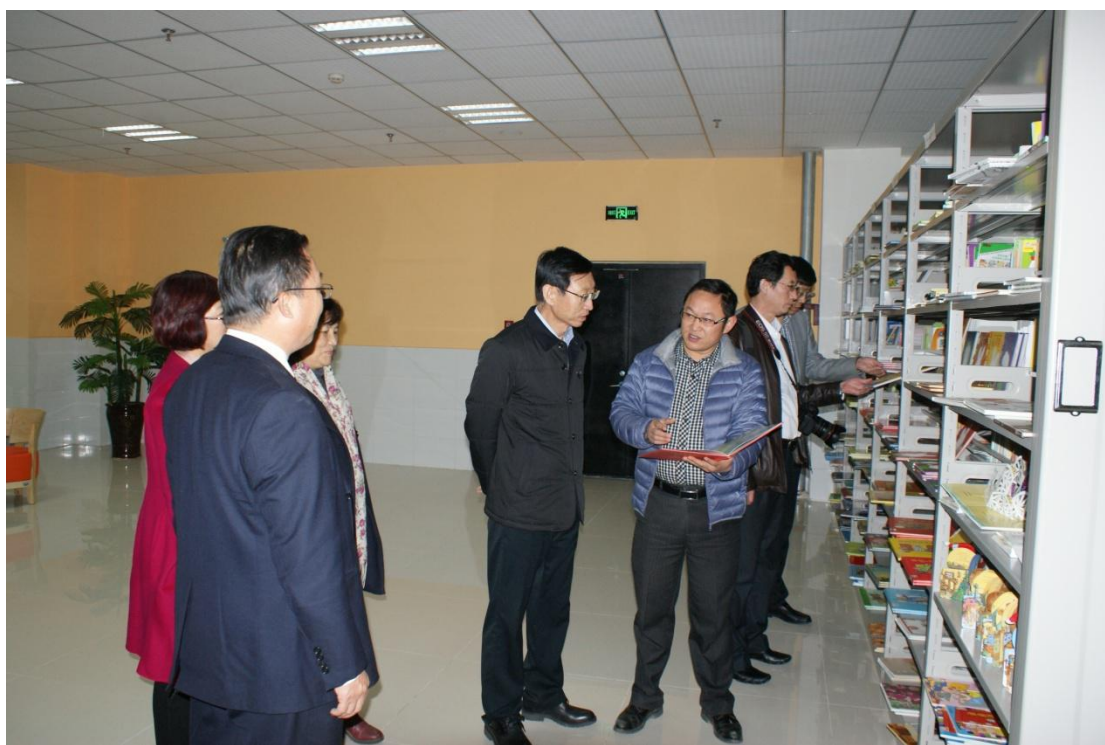
林局长一行在图书馆幼教特色阅览室考察