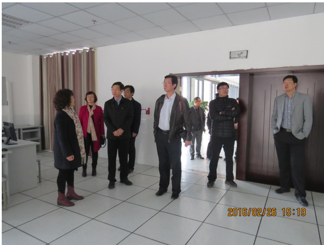
图为林局长一行在图书馆电子阅览室考察