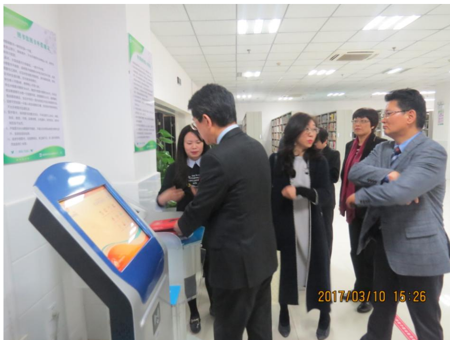
体验图书自助借还设备