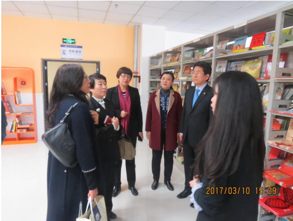
参观幼教特藏借阅室并交流

此次参观交流，为双方建立深厚的友谊，进一步加强互访学习、开展合作交流、共同为高等教育事业国际化发展和中韩文化交流作出积极贡献。