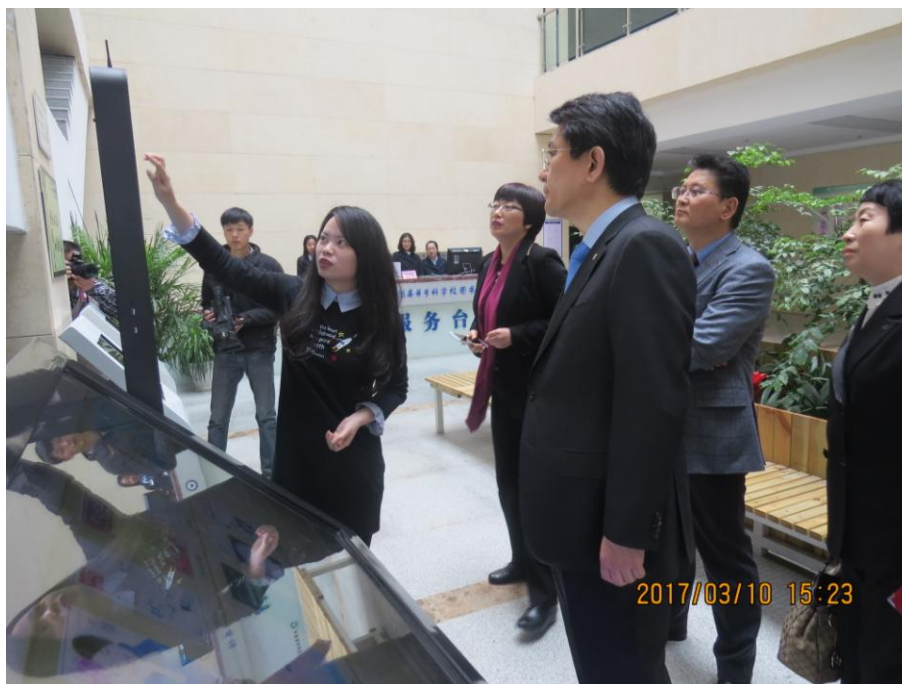
详细了解馆内智能设施