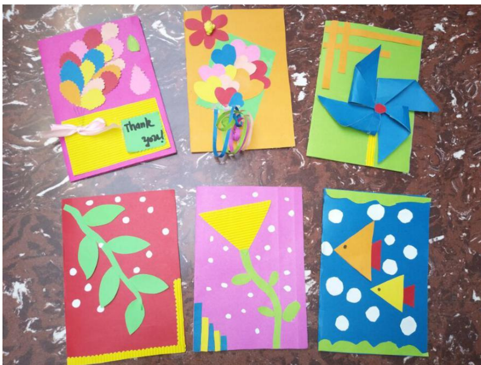
幼儿园小朋友制作的贺卡充满童心和快乐

活动最后，图书馆的老师们还与小朋友们一起跳了早操舞蹈，和孩子们一起感受童年的快乐！