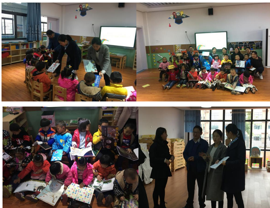
新店花园幼儿园送书现场

图书馆和幼儿园的老师做好本次绘本交接之后，将上一期漂流的绘本进行清点、回收，整理后漂流至下一站一幼专附幼新店花园幼儿园。