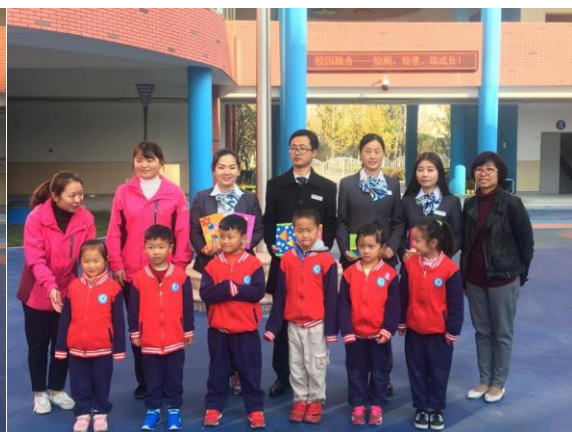
小朋友将亲手制作的贺卡赠送给图书馆的老师