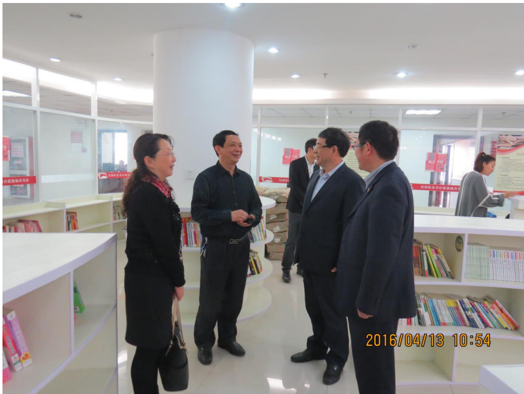
淝南社区盛书记热情欢迎调研小组一行