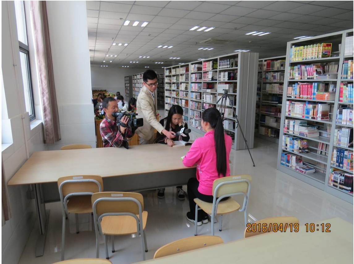
记者正在采访在图书馆看书的学生