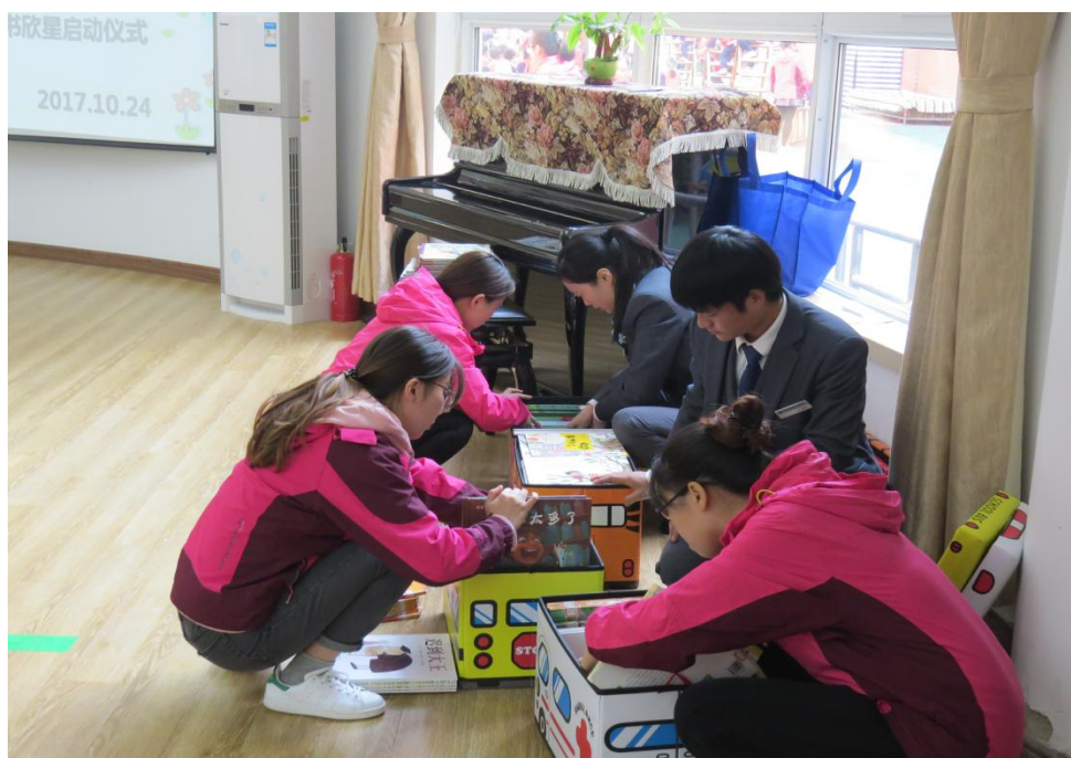
图书馆工作人员与欣星分园老师现场进行书目清点交接