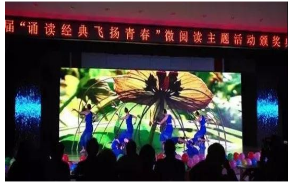
我校学生表演民族舞蹈《傣家小妹走过来》