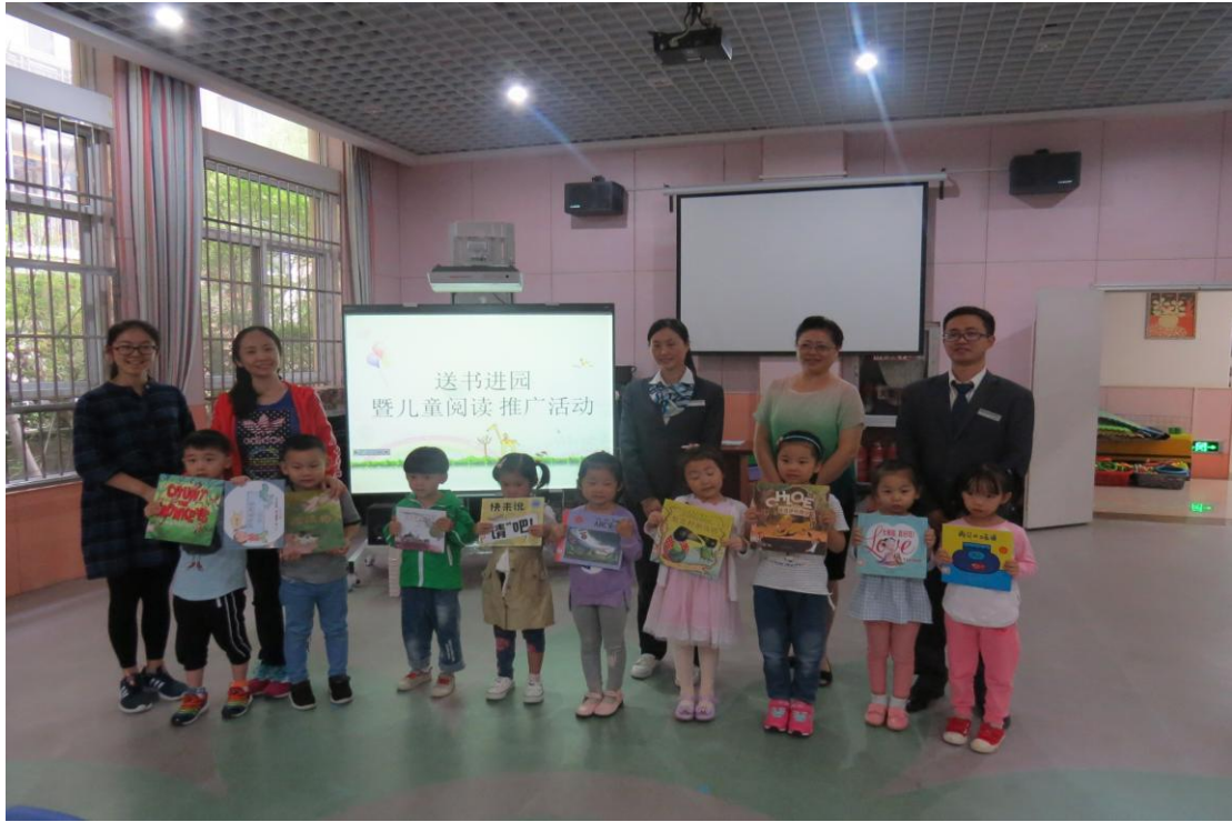
琥珀名城沁园幼儿园送书现场