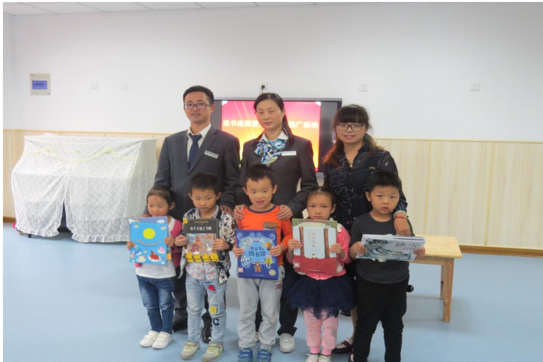
世纪荣廷幼儿园送书现场