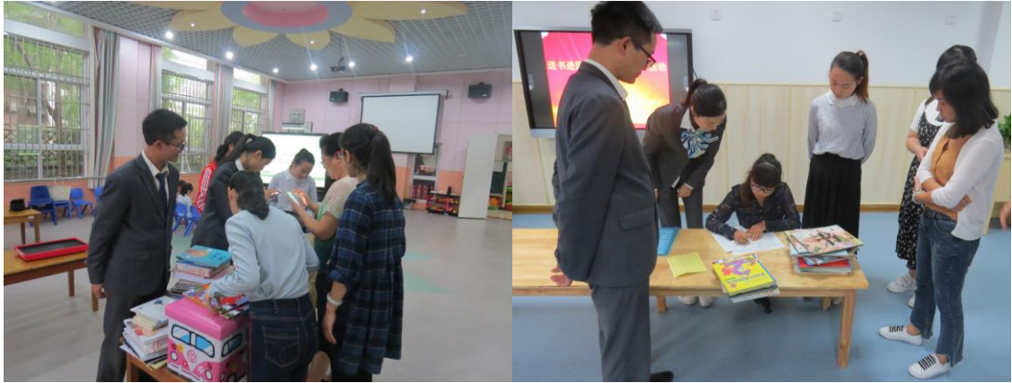
图书馆工作人员与幼儿园分园老师现场进行书目清点交接

送书仪式爱心满满，孩子们迫不及待地接过一本本精美的绘本，爱不释手，用甜甜的笑容表达对馆长伯伯、老师阿姨的感谢。部分幼专图档专业学生还现场给孩子们讲述了一个个精彩的绘本故事，小朋友们听得津津有味。