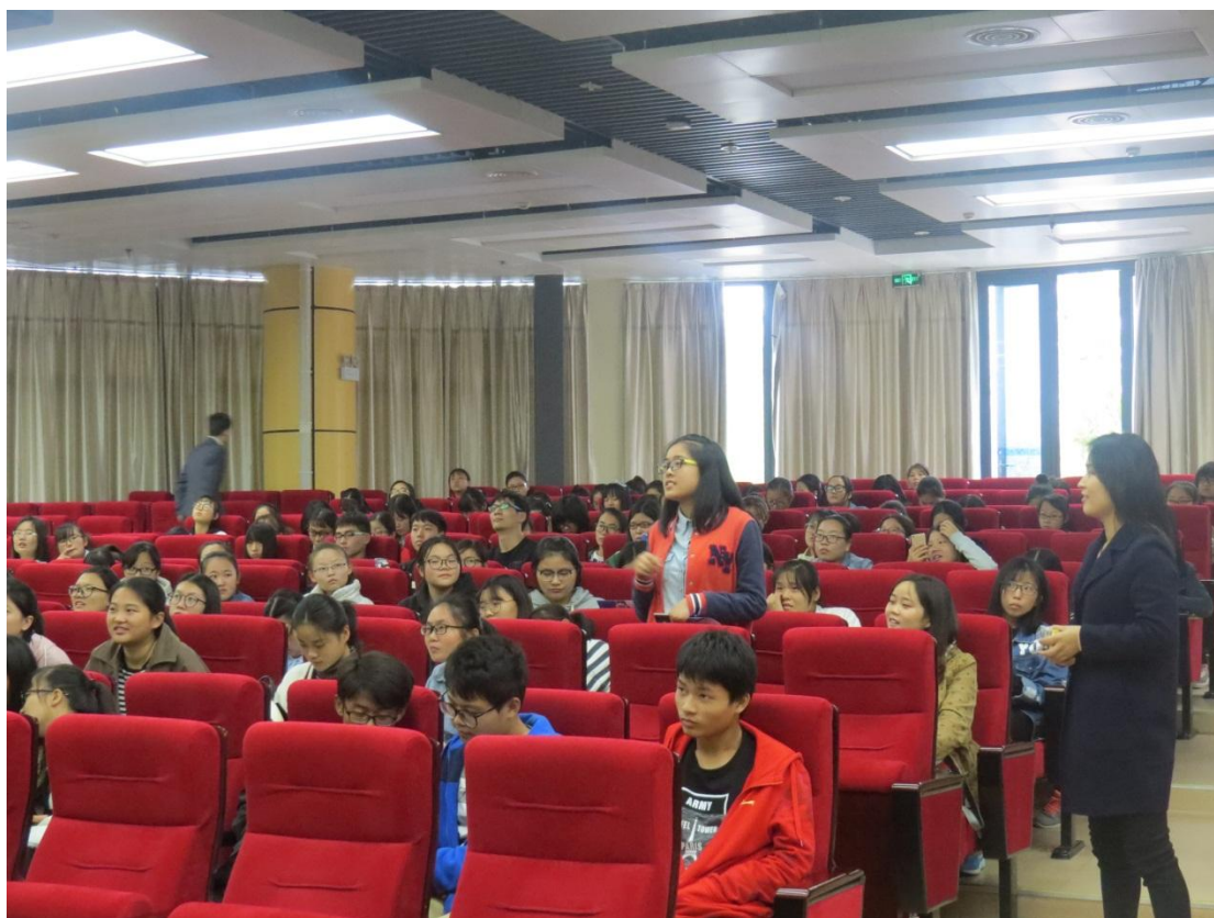
讲座现场，师生读者纷纷与两位讲师进行了互动交流。

此次讲座，在推广我校图书馆的数字化资源的同时，图书馆运营团队还对微信公众号等新媒体平台进行了现场宣传及推广。今后，校图书馆将进一步加大对全校师生进行图书馆数字资源利用培训和宣传推广力度，更好地促进图书馆利用率，为教育教学和科研提供有力支撑和保障。